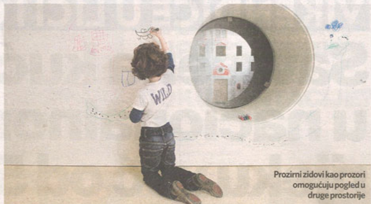
Prozirni zidovi kao prozori omogućuju pogled u druge prostorije