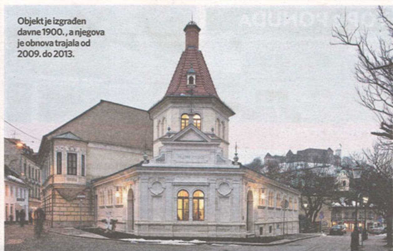
Objekt je izgrađen davne 1900., a njegova je obnova trajala od 2009. do 2013.